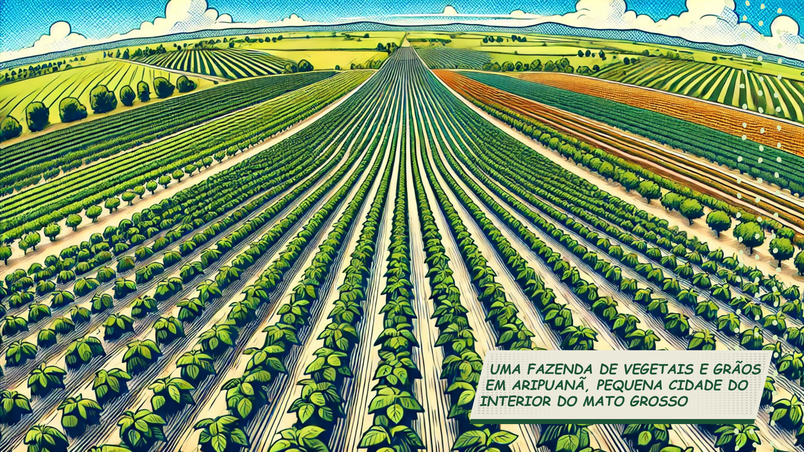
UMA FAZENDA DE VEGETAIS E GRÃOS EM ARIPUANÃ, PEQUENA CIDADE DO INTERIOR DO MATO GROSSO